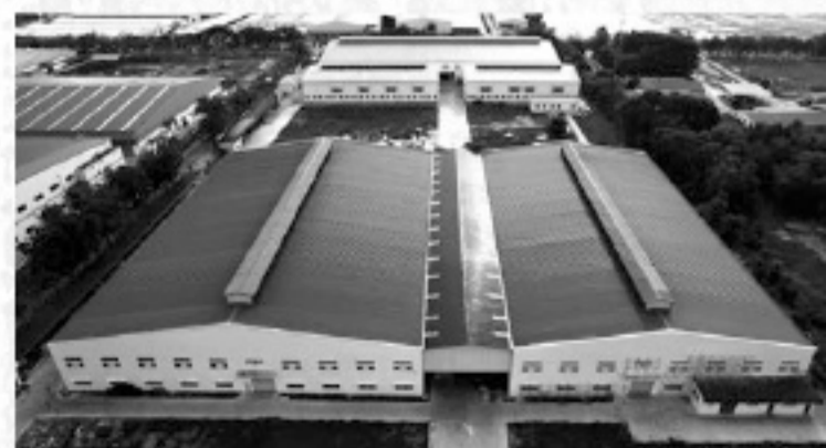
Phoenix Artist Materials (Cambodia) Co., Ltd.