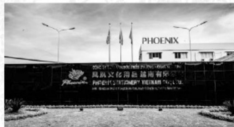
Phoenix Stationery Vietnam Co., Ltd.