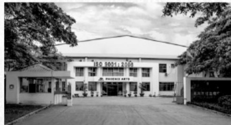
Phoenix Artist Materials Vietnam Co., Ltd.