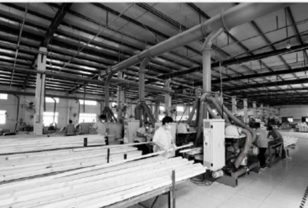
Wood production workshop

Das Unternehmen hat drei unabhängige Marken: PHOENIX (positioniert bei professionellen Künstlern im In- und Ausland), AUREUO (Positionierung bei Studenten und Hobbies im Ausland) und BONFIL (Positionierung in Kindermalereien im Inland). Die differenzierte Positionierung ihrer Hauptmarken entspricht den Bedürfnissen aller Verbrauchsstufen. Das Unternehmen wurde seit vier aufeinanderfolgenden Jahren mit dem nationalen Schlüsselunternehmen oder dem Projekt des Kulturexports, den Top-Ten-Marken chinesischer Kunstlieferungen und dem bekannten Markenzeichen China s ausgezeichnet. Das Unternehmen verfügt über eine Reihe von Zertifikaten zur Unternehmensführung und -qualität.