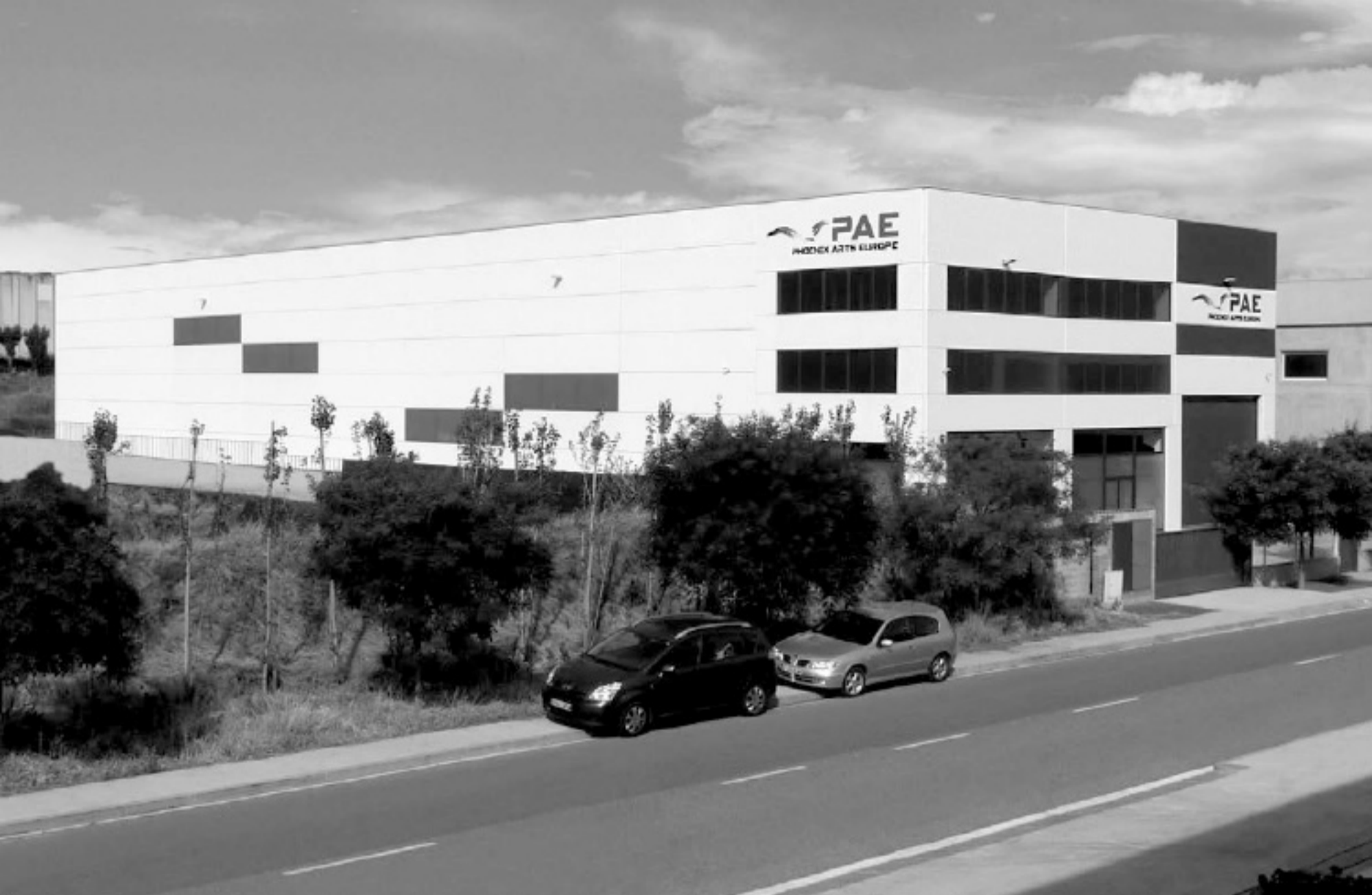
Phoenix Arts Europe (Spain)

el extranjero), y BONFIL (posicionada en materiales de pintura infantil nacional). La diferenciación de sus marcas principales responde a las necesidades de todos los niveles de consumo. Por cuarto año consecutivo, la compañía ha sido galardonada como una empresa o proyecto de exportación cultural clave a nivel nacional, dentro de las diez mejores marcas de suministros de arte en China y las marcas comerciales más conocidas de China. Además, la empresa cuenta con varios certificados de gestión y calidad empresarial.