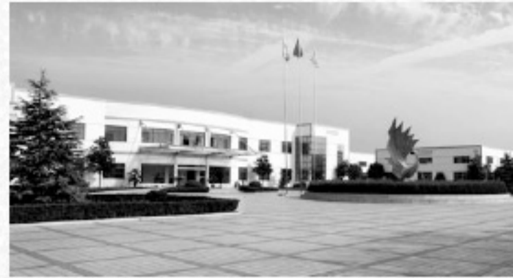
Shuyang Phoenix Artist Materials Co., Ltd.