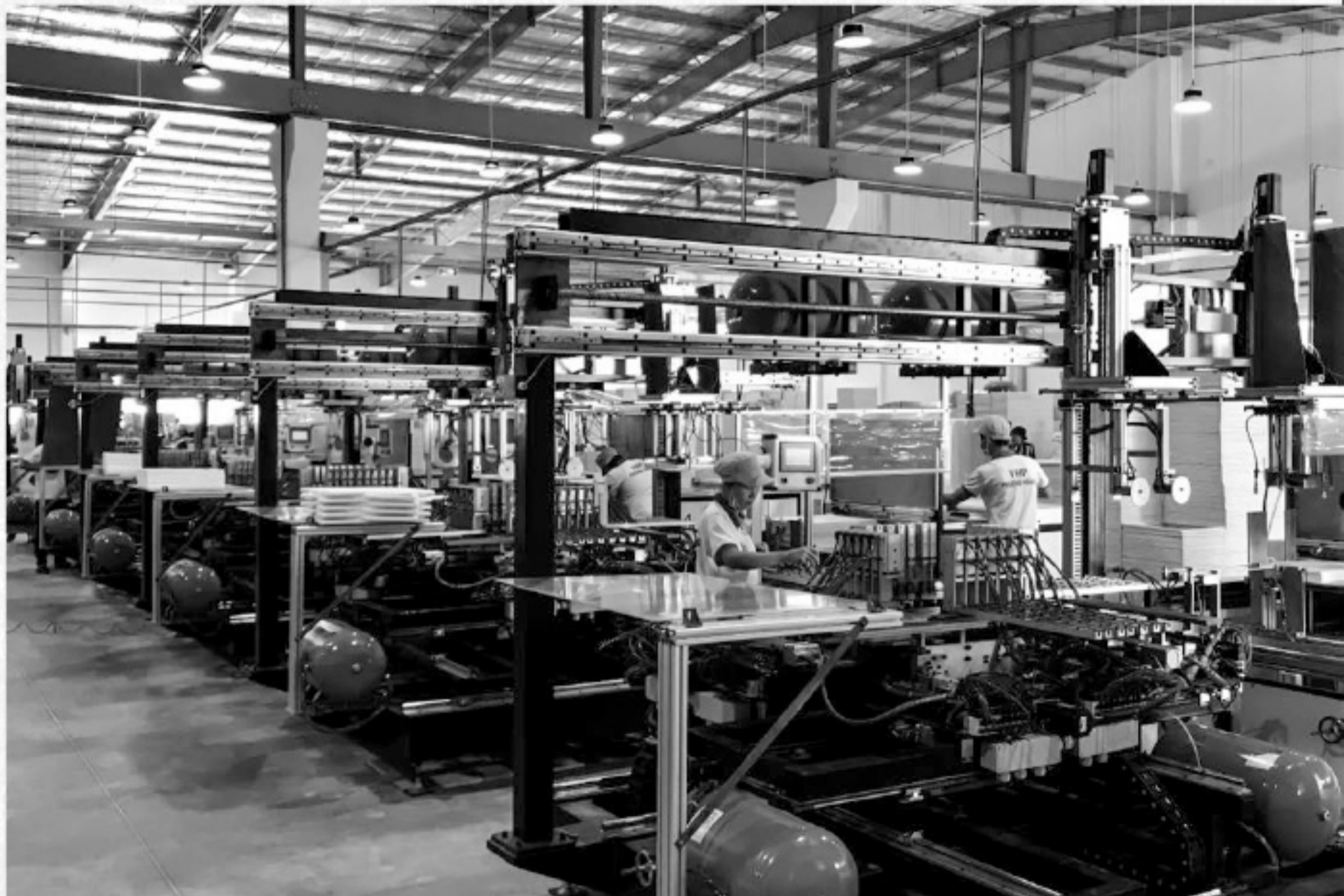
Automatic stretch canvas assembly line

Jiangsu Phoenix Art Materials Technology Co., Ltd Créé en 1995 et créé en 2001. Elle prend la recherche et le développement (R&D) et la fabrication de matériaux de peinture et le développement de l'industrie de l'art comme industrie de pointe. Dans l'esprit de « ALL FOR ART» le concept de développement, elle adhère à la professionnalisation, l'internationalisation, la marque de la voie du développement. A ce jour, elle est devenue un fabricant de recherche et de développement de matériaux de peinture à l'huile de renommée mondiale L'échelle des ventes de toiles à l'huile et de cadres à l'huile s'est classée première au monde, mais aussi dans le domaine des ventes de peinture des plus grandes entreprises chinoises. Au sein de l'entreprise, elle se concentre sur le développement de l'innovation et le développement de la transition afin de mener l'innovation de façon autonome à la qualité du développement de l'entreprise. Chaque année, la société investit beaucoup de fonds dans la mise en œuvre de produits de peinture intelligents, automatisés de production et de transformation. En 2018, la première ligne de production automatique de toile tendue d'artiste au monde a été construite.