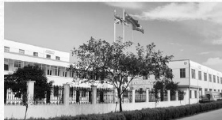
Shuyang Phoenix Art Paints Co., Ltd.